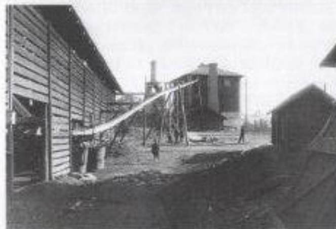
Hyttan fotograferad från norr (Öskebohyttvägen).

På östra sidan av vägen mot Öskebohyttan låg det stora kolhuset, som syns på fotot taget från norr. Där syns kolets bana som transporterade kolet upp till masugnskransen. Grundstenarna till huset finns fortfarande kvar, liksom uppfartsvägen för hästfororna. Kolhuset revs i början av 1940-talet och virket användes som bränsle under krigsåren. På norra delen av platsen för kolhuset är uppfört ett redskapshus och foderlada, vartill den gamla inkörsbron till kolhuset har använts.