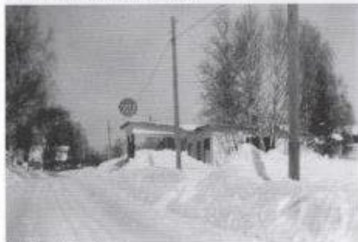
Här byggdes brandstationen.